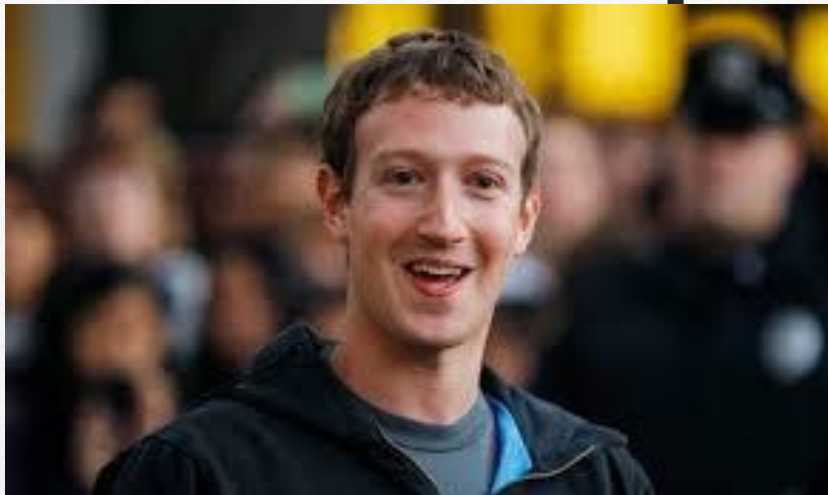
• מרק צוקרברג