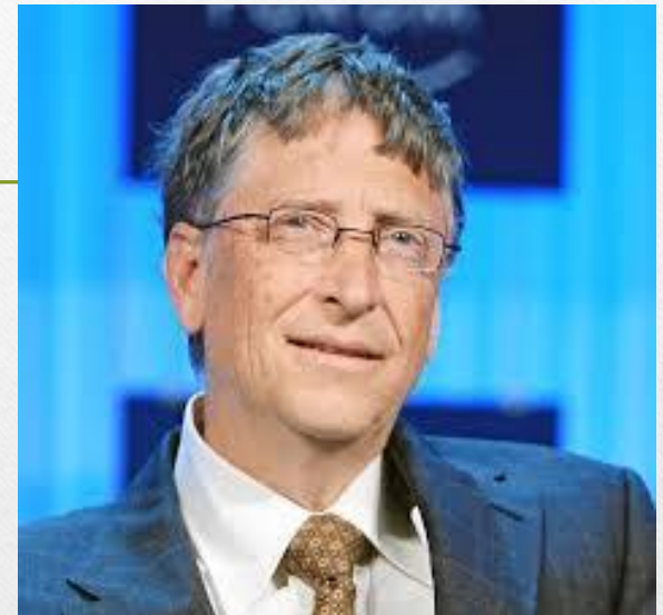
• ביל גייטס